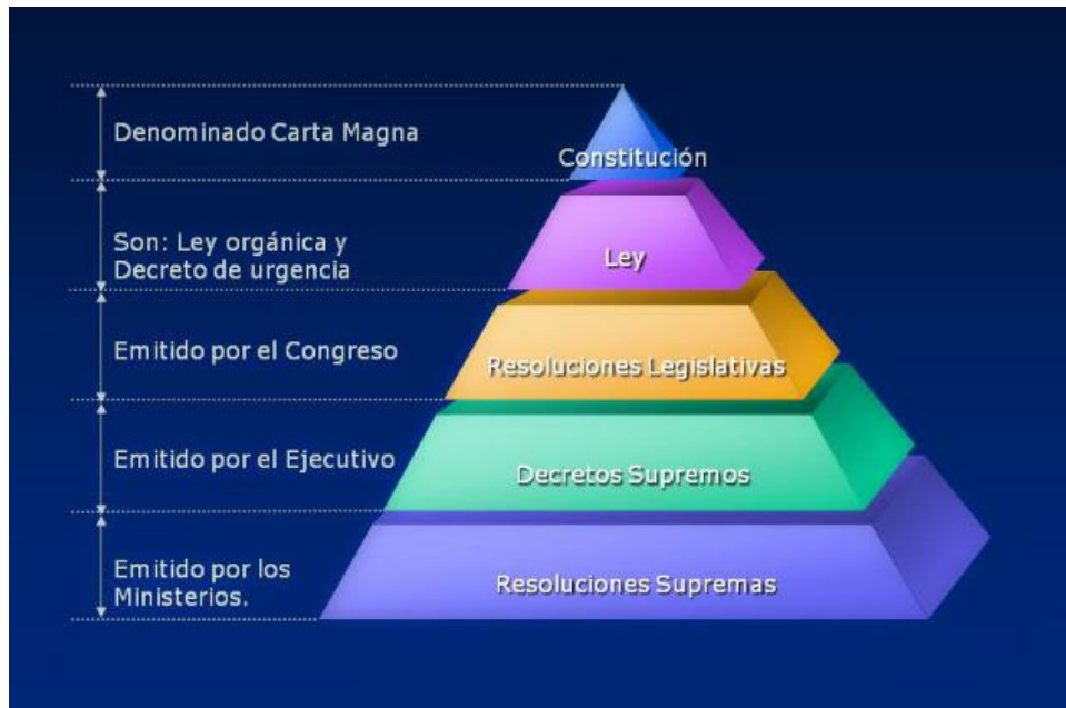
Ilustración 1. Pirámide de Kelsen