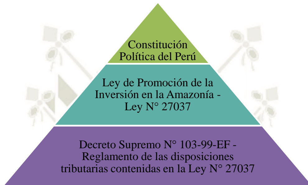
Ilustración 2. Pirámide de Kelsen aplicada al caso de la empresa Inversiones Maldonado S.A.C.

“pirámide jurídica”, la que compone un sistema jurídico en el cual la Constitución prevalece en la cúspide sobre todas las demás normas.