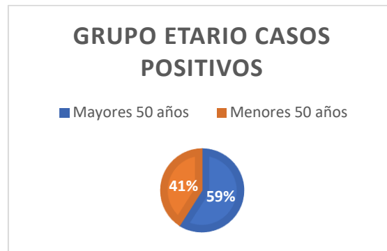
Figura 03: Grupo etario de pacientes con cultivo positivo.