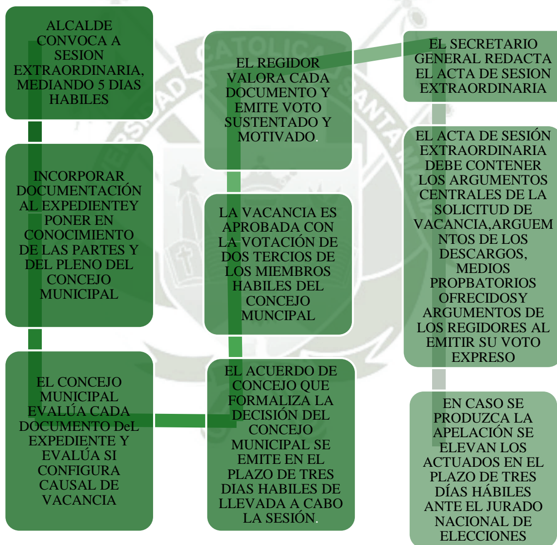
Figura 3. Propuesta de procedimiento.

Nota. Flujograma de la propuesta del procedimiento de vacancia de autoridades municipales. Figura creada por la autora.